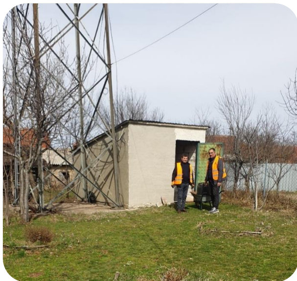
Repetitori në Ivajë dhe Drenas