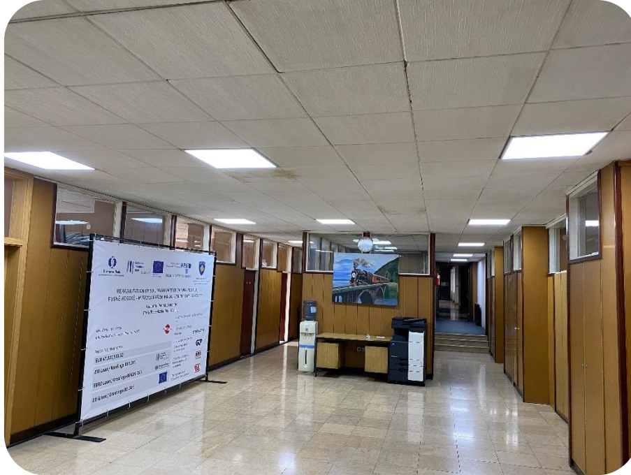
Ndriçim i objekteve të Infrakos-it me LED

Ndër sfidat kryesore me të cilat sektori i veprimtarisë elektroteknike vazhdimisht përballet janë vjedhjet e vazhdueshme të kablove apo pajisjeve tjera sinjalo siguruese si dhe mungesa e pjesëve rezervë.