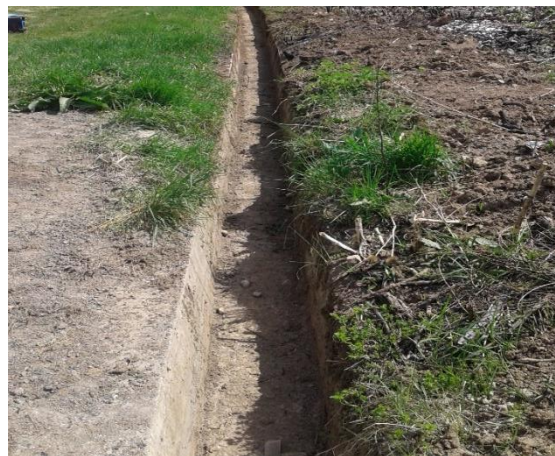
Pastrimi i profilit dhe kanalit ujë përcjellës