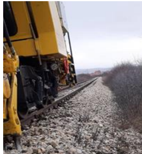
Gjendja pas intervenimit