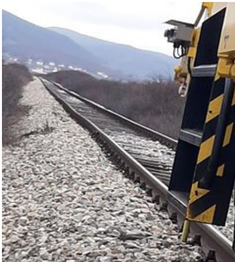
Gjendja para intervenimit

Në fotografitë në vazhdim janë paraqitur gjendja e deformimeve të binarëve dhe gjendja pas intervenimit dhe rehabilitimit të binarit në linjë të hapur.